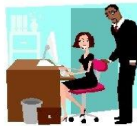
Зарплата, гонорар или прибыль