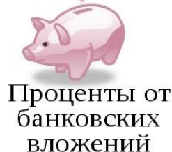
Проценты от банковских вложений